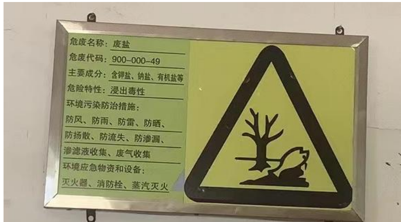
危险废物储存场所标识牌